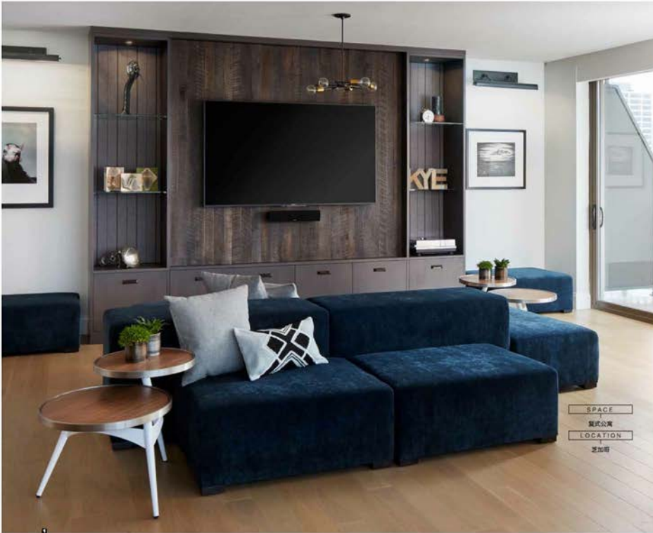
SPACE —— 复式公寓 LOCATION —— 芝加哥